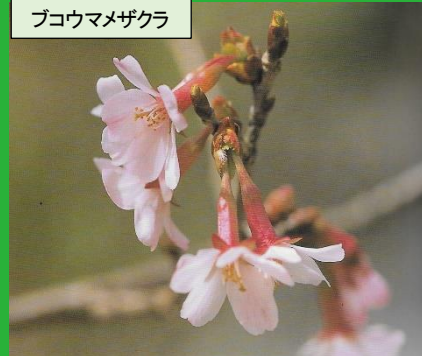
ブコウマメザクラ